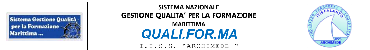
FIGURE DEL SISTEMA GESTIONE QUALITA'